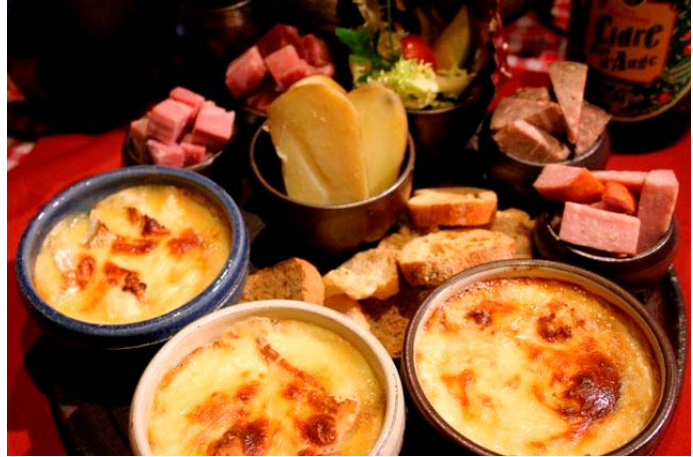
Retrouver nos recettes sur internet en cliquant sur l'image